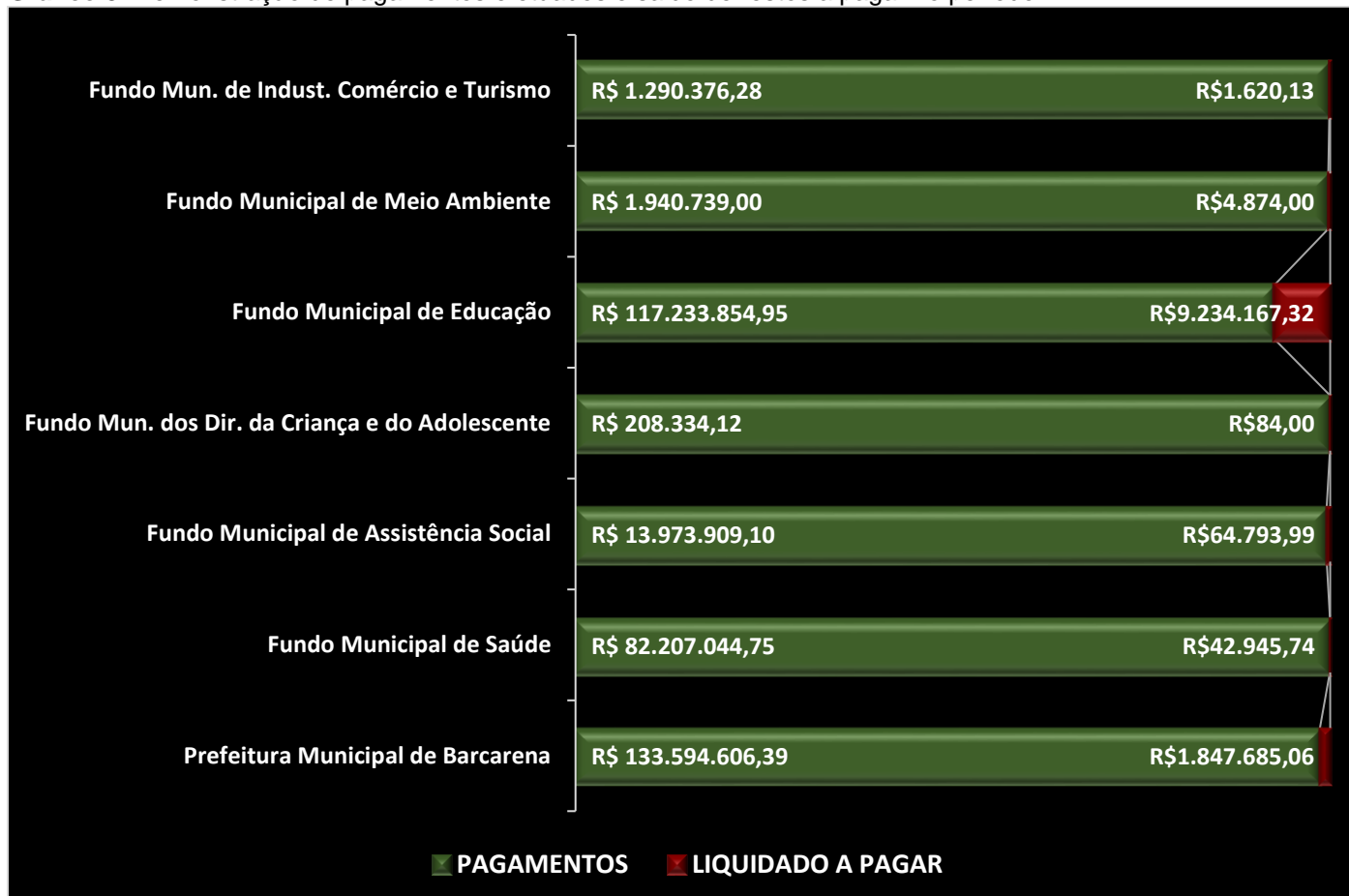
Gráfico 3. Demonstração de pagamentos efetuados e saldo de restos a pagar no período.

Dos recursos aplicados na manutenção e desenvolvimento do ensino, foi aplicado o montante de R$ 69.077.497,02 de recursos próprios, computados para fins de cumprimento da exigência constitucional disposta no caput do artigo 212 da Constituição Federal, sendo equivalente a 25,01% da receita resultante de impostos.