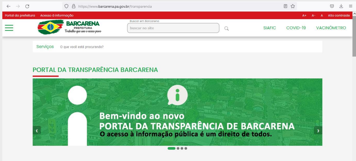
Figura 05: Página principal do Portal da Transparência municipal