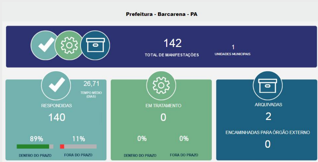
Figura 01: Total de manifestações no ano

Fonte: Painel Resolveu da CGU (consulta realizada dia 27/01/2022)