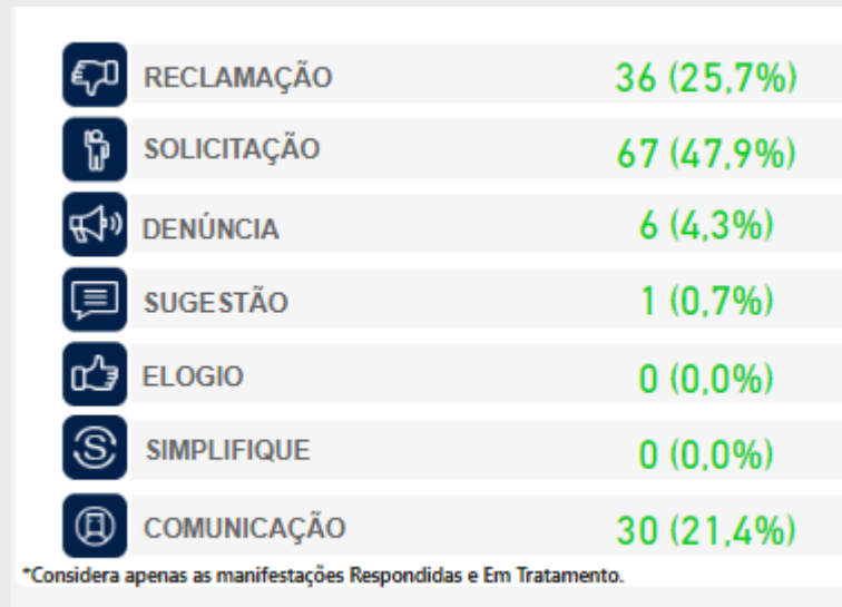
Figura 03: Tipos de manifestações do ano de 2021